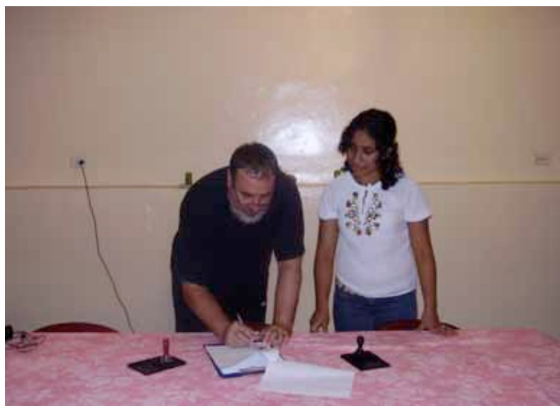
El Presidente de la OP firma el convenio de colaboración

Se han firmado convenios de colaboración OP, Comité Central de Salud, Secretaría Departamental de Salud y Hospital de Santa Bárbara, en los que se establecen las funciones y compromisos de cada parte en la ejecución y desarrollo del