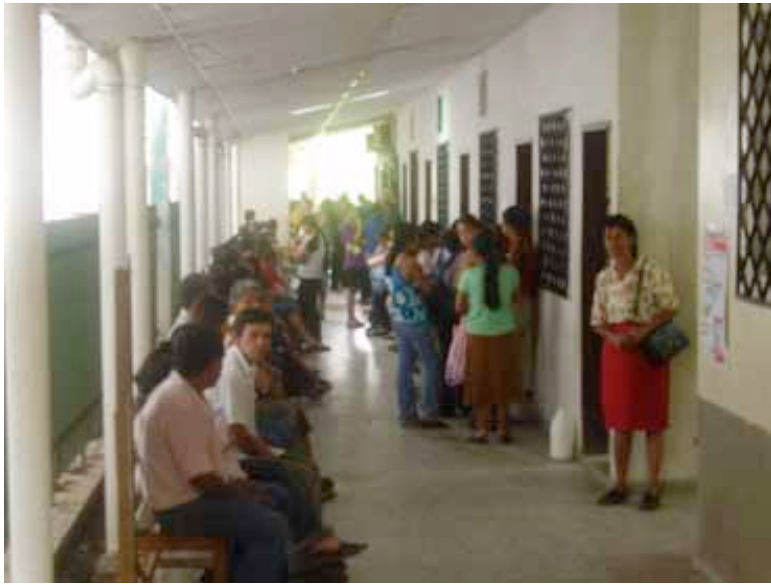
Vista de una sala de espera del Hospital de Santa Bárbara

Txema Arginzóniz nos transmite una pequeña crónica de su estancia en el hospital de Sta. Bárbara